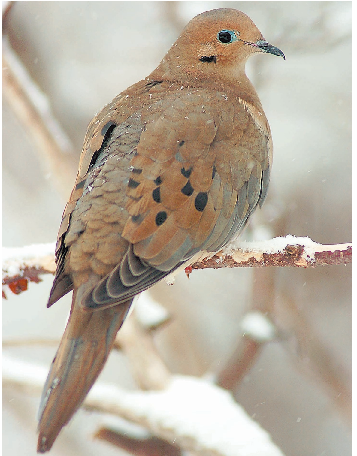
COLLABORATION SPÉCIALE, SERGE BEAUDETTE

Parmi ces espèces, nous notons la très jolie Mésange bicolore. Du même gabarit que sa cousine la Mésange à tête noire, elle arbore une petite huppe caractéristique, un magnifique plumage bleuté, émet un chant sifflé et très sonore (au printemps) et démontre un comportement beaucoup plus furtif. Sa