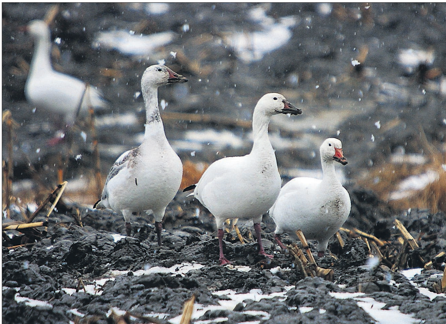
COLLABORATION SPÉCIALE, SERGE BEAUDETTE

Certaines portions de plans d'eau qui ne gèlent jamais, à cause du courant ou d'un rejet d'eaux plus chaudes par une usine par exemple, vont permettre à certains oiseaux habituellement migrateurs