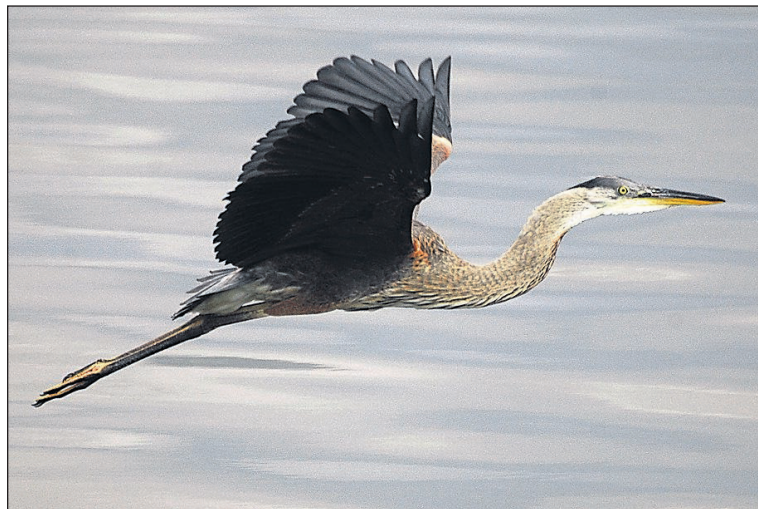
COLLABORATION SPÉCIALE, SERGE BEAUDETTE

Pour les amoureux des oiseaux, vous pouvez en apprendre davantage et m'écrire à partir du site: www.pitpitpit.com