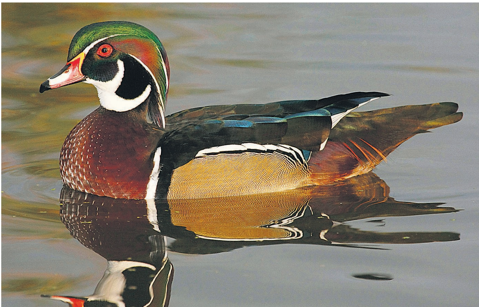
COLLABORATION SPÉCIALE, SERGE BEAUDETTE

Plusieurs mâles se regroupent et amorcent alors un ensemble d'actes ritualisés, synchronisés, des danses, accompagnées de cris spéciaux, exécutées avec soin et dans le but de mettre en valeur des attributs, d'épater, de séduire et finalement de conquérir la belle. Tout se passe comme si tout était robotisé et sans spontanéité... ou du moins, de façon prévisible, même pour l'observateur humain qui s'y reconnaît parfois! Toilette exubérante, nettoyage exagéré et démonstratif des plumes les plus chatoyantes, mouvements