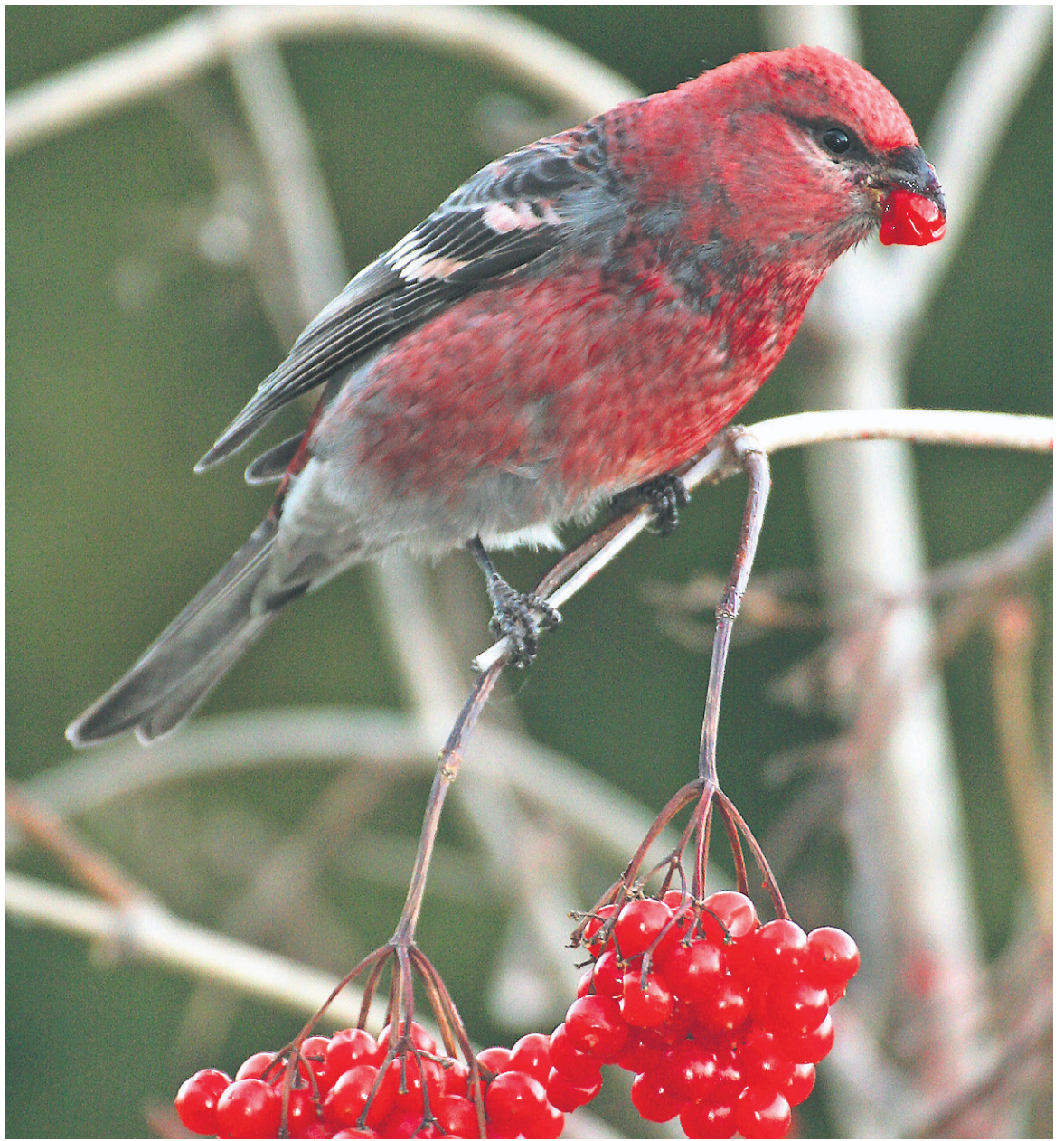
COLLABORATION SPÉCIALE, SERGE BEAUDETTE

Pour les amoureux des oiseaux, vous pouvez en apprendre davantage et m'écrire à partir du site: www.pitpitpit.com