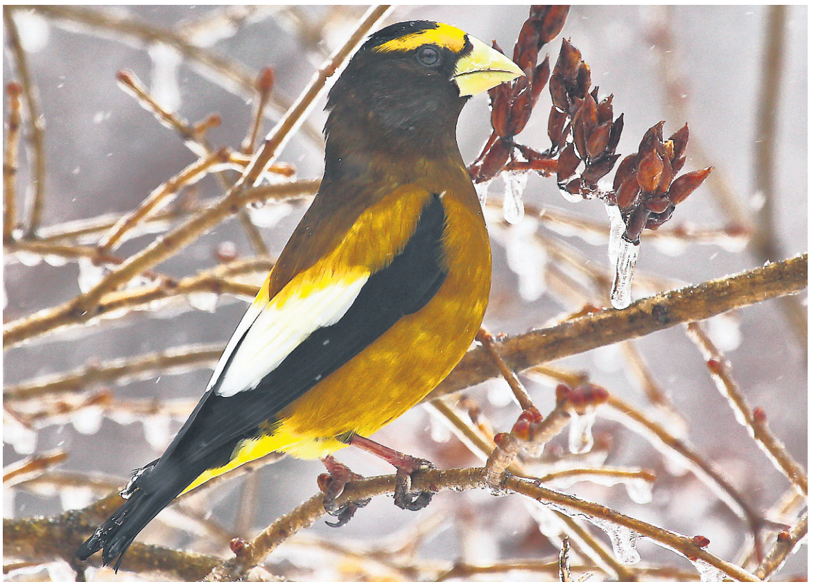
COLLABORATION SPÉCIALE, SERGE BEAUDETTE

Ce sont les mâles adultes du Durbec des sapins qui sont roses. Ils partagent l'espace avec des congénères roux et verdâtres. L'absence de fruits dans le nord force ces magnifiques créatures boréales à venir