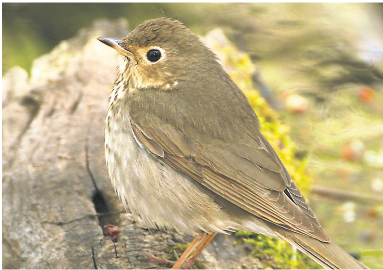
COLLABORATION SPÉCIALE, SERGE BEAUDETTE

Pour les amoureux des oiseaux, vous pouvez en apprendre davantage et m'écrire à partir du site: www.pitpitpit.com .